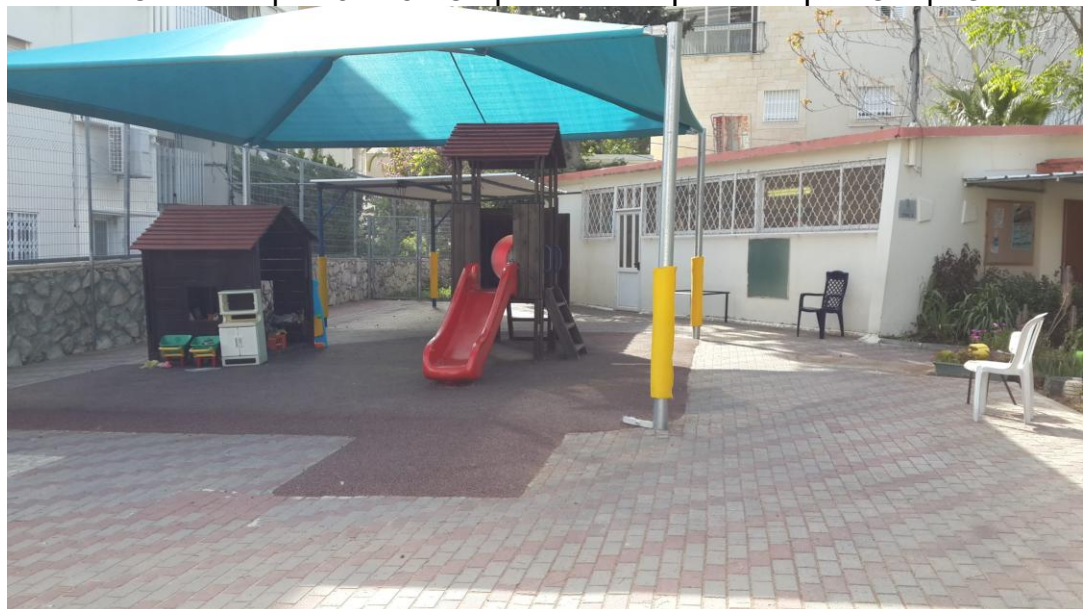
עמוד 6 מתוך 9

חצר המשחקים של הגן ומבנה הגן. המבנה ממוקם כ- 15 מטר מקווי המתח שברחוב.